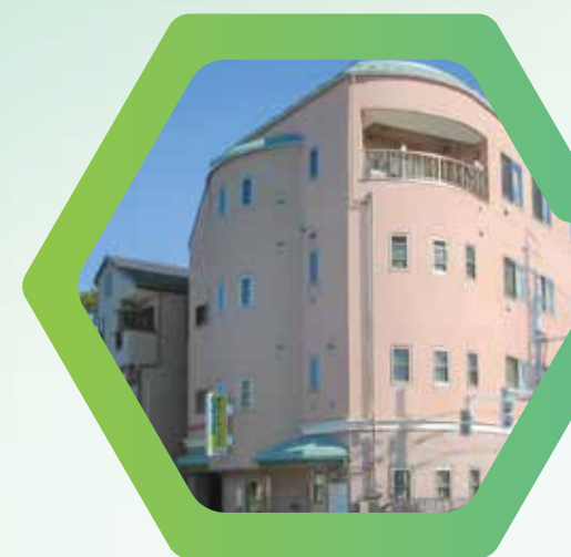
東部デイサービスセンター 東部認証保育所