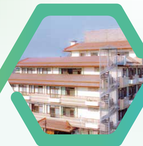
瑞江特別養護老人ホーム