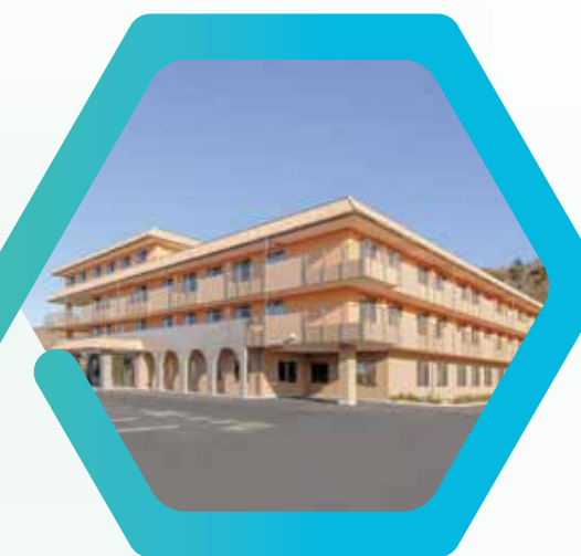
袖ヶ浦瑞穂特別養護老人ホーム